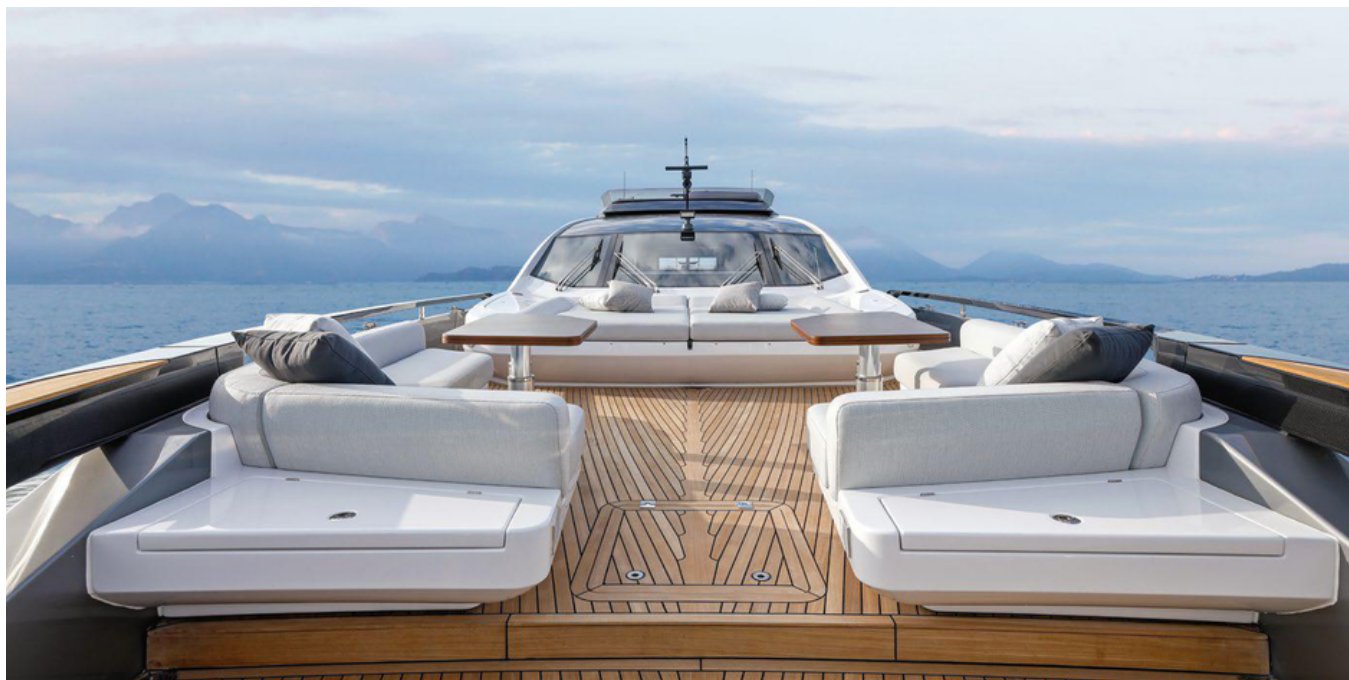
Носовая часть палубы