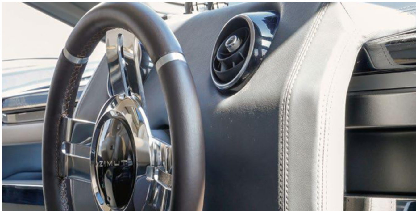
Главный пост управления