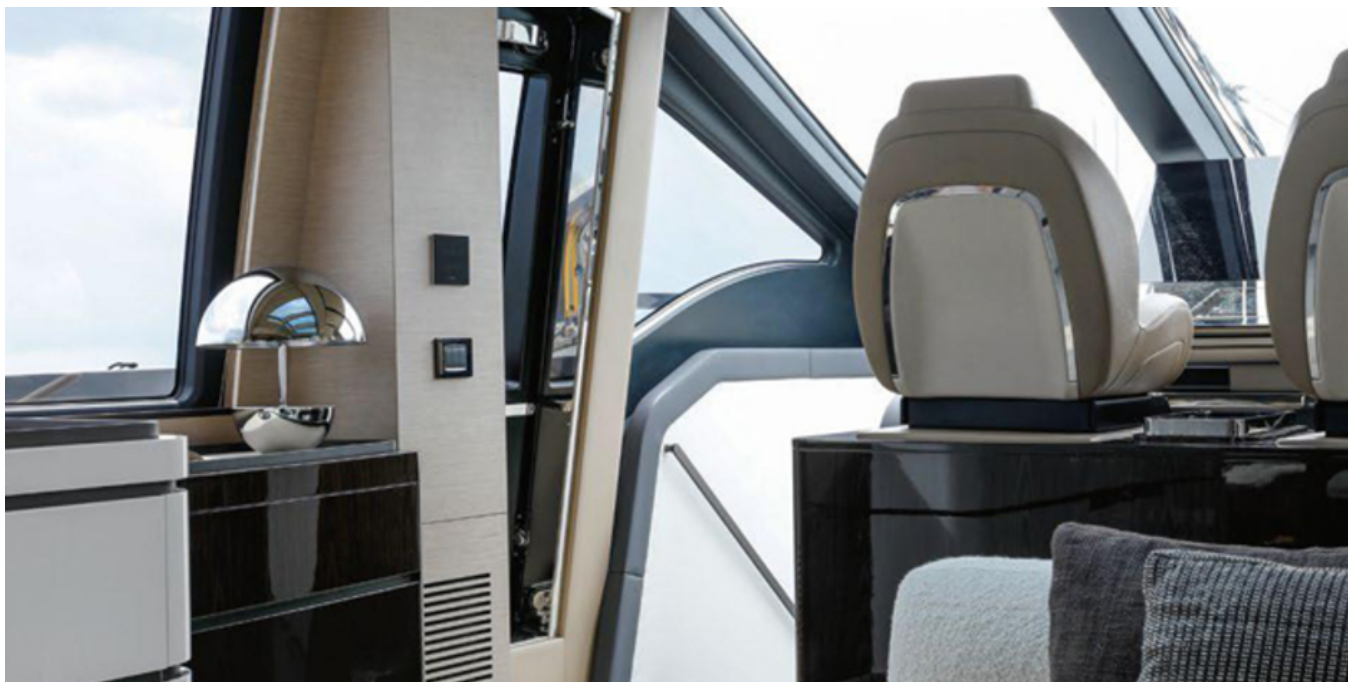
Салон на главной палубе