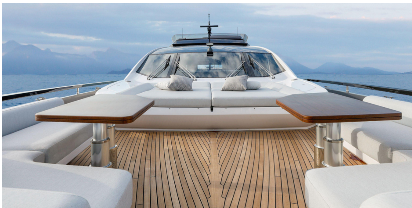
Носовая часть палубы