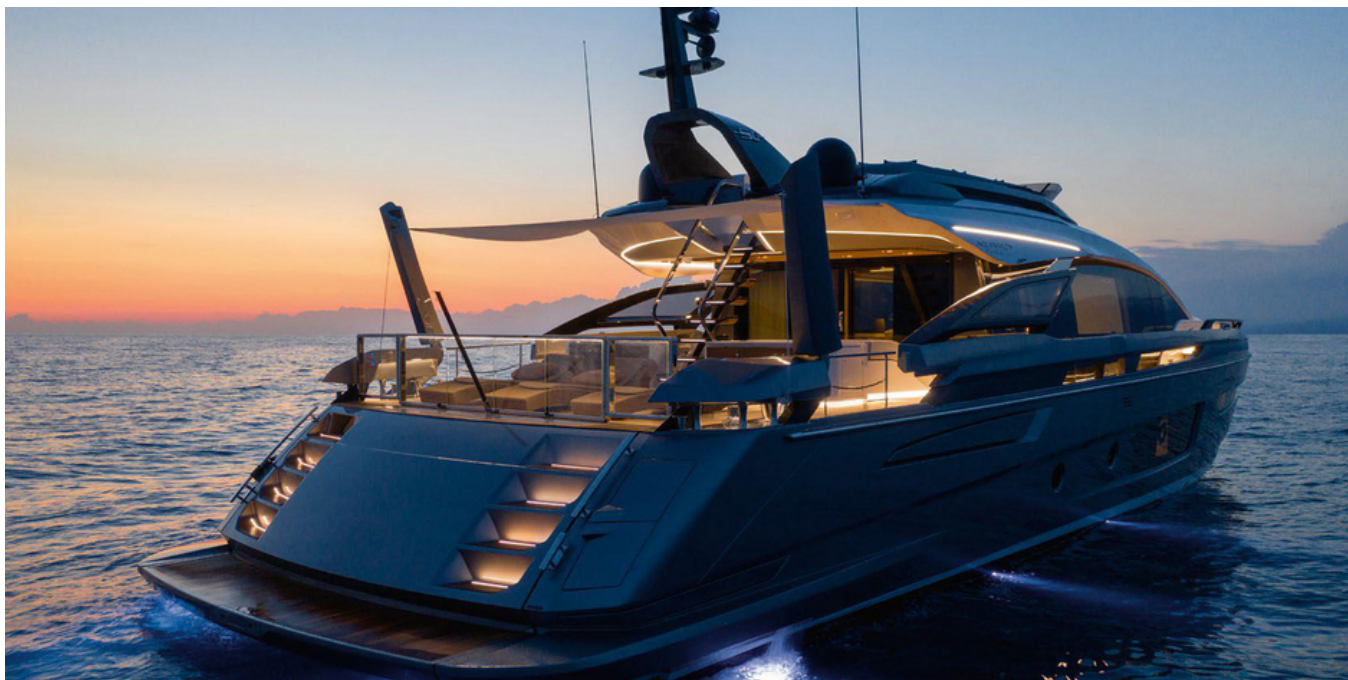
Экстерьер Azimut Grande S10