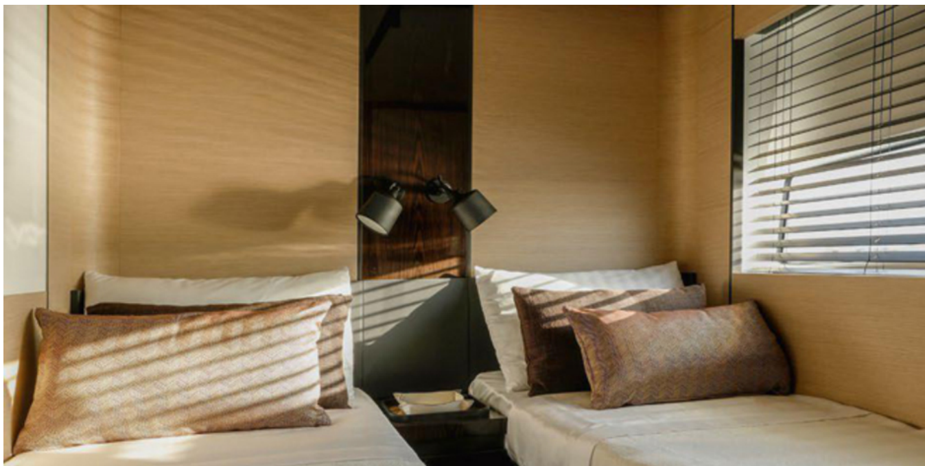
Гостевая каюта по левому борту