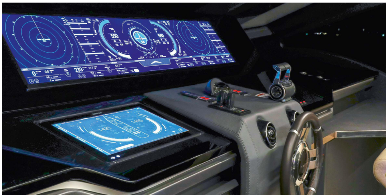
Главный пост управления