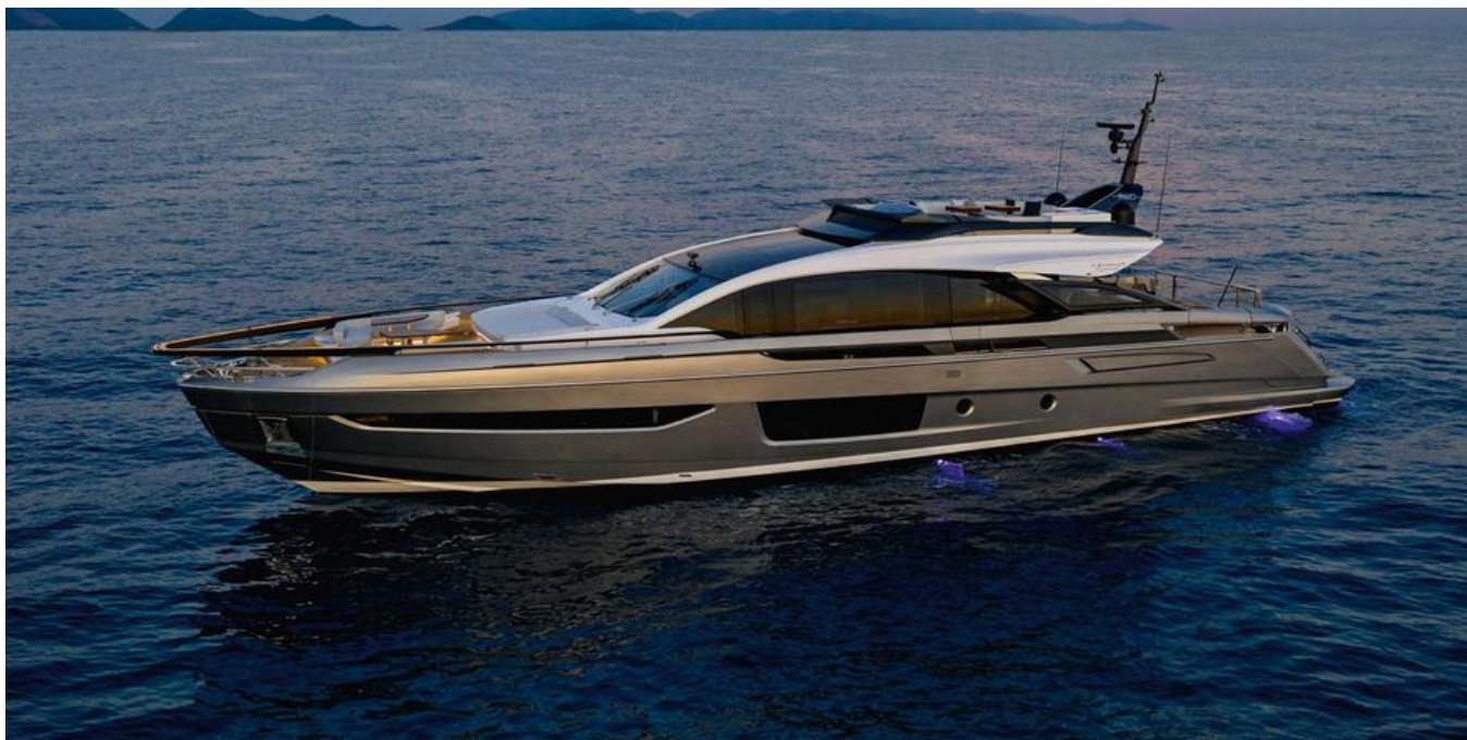
Экстерьер Azimut Grande S10