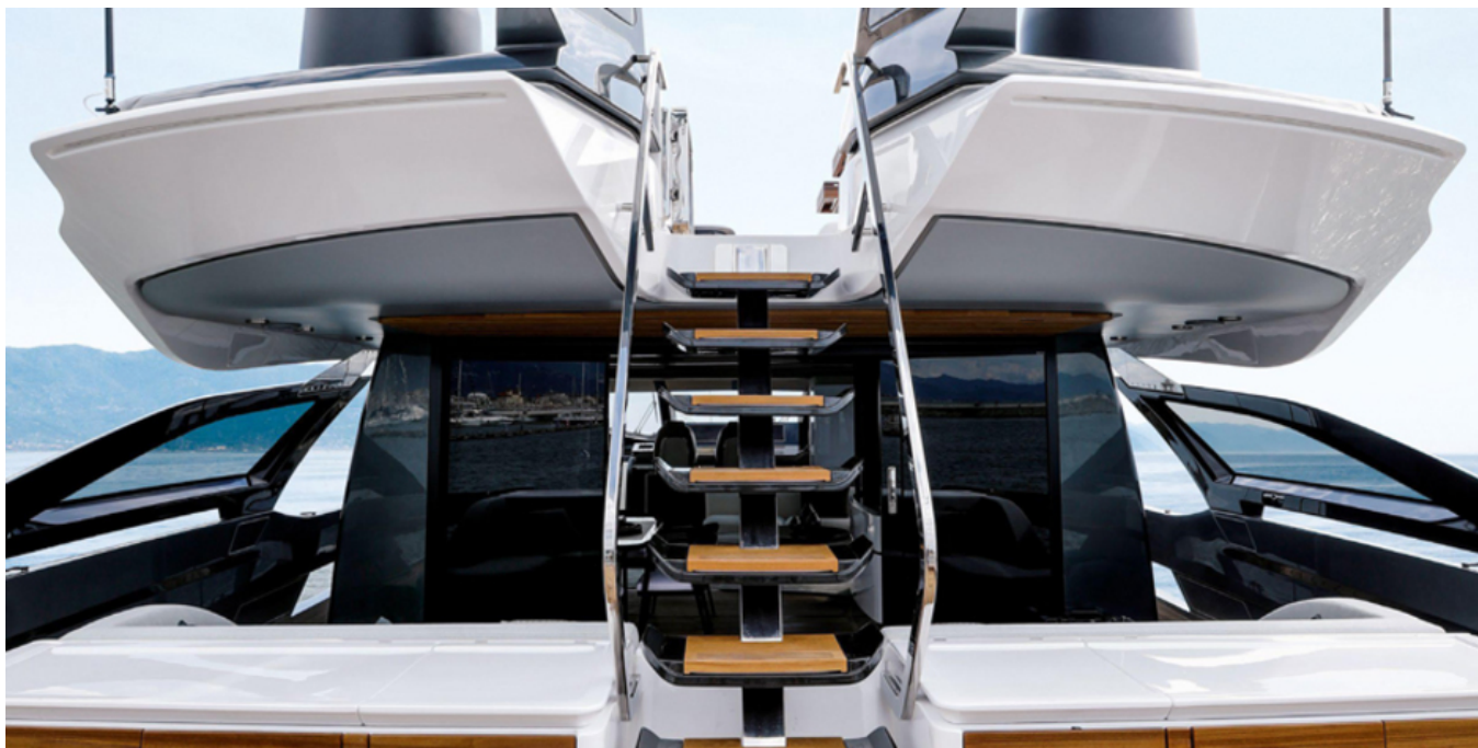
Ступени на кокпит