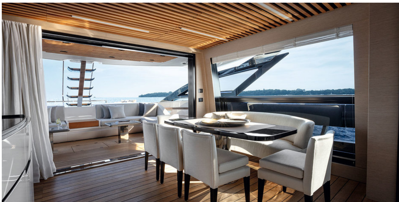
Салон на главной палубе