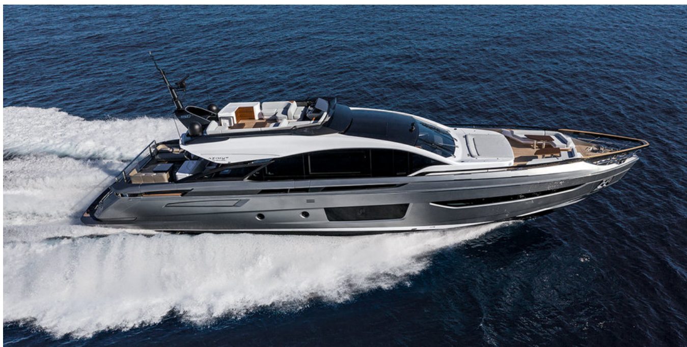
Экстерьер Azimut Grande S10