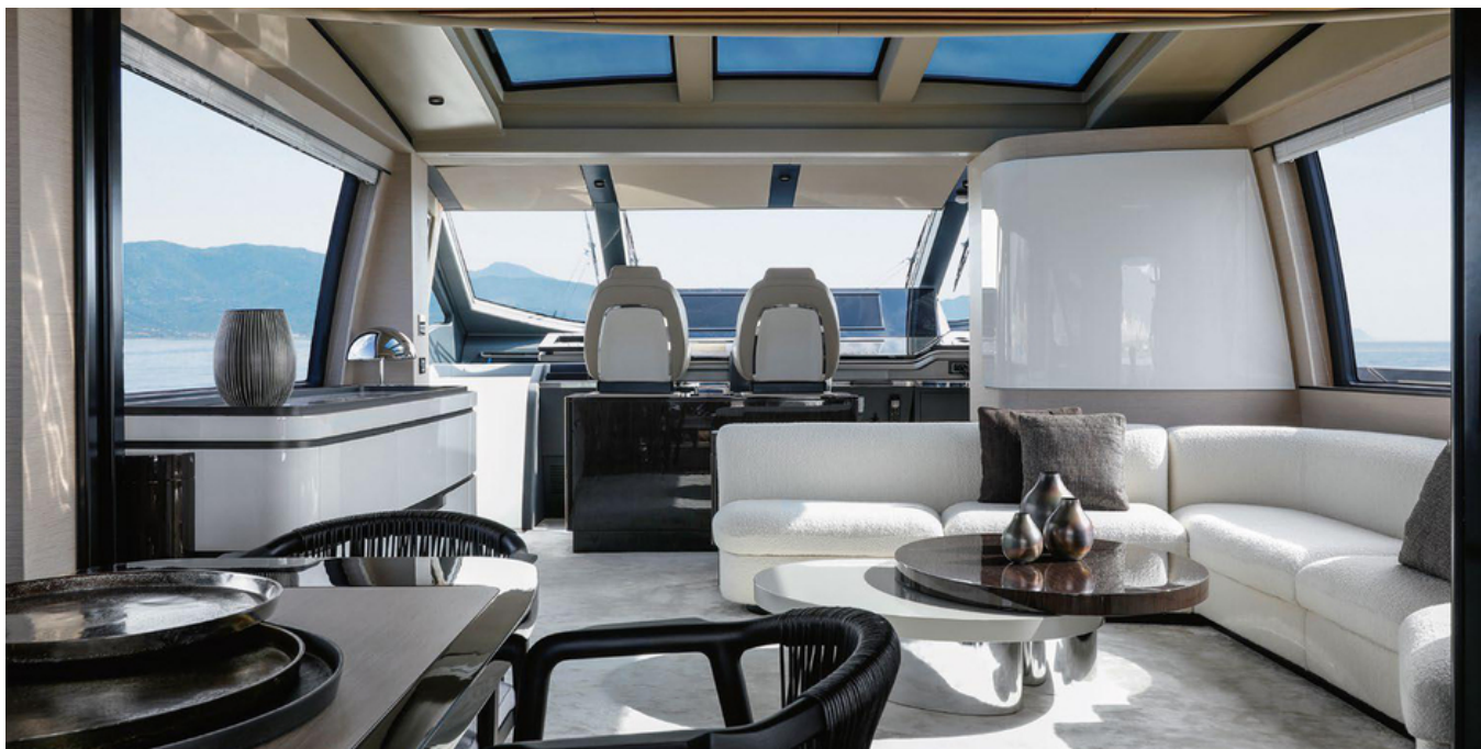
Салон на главной палубе