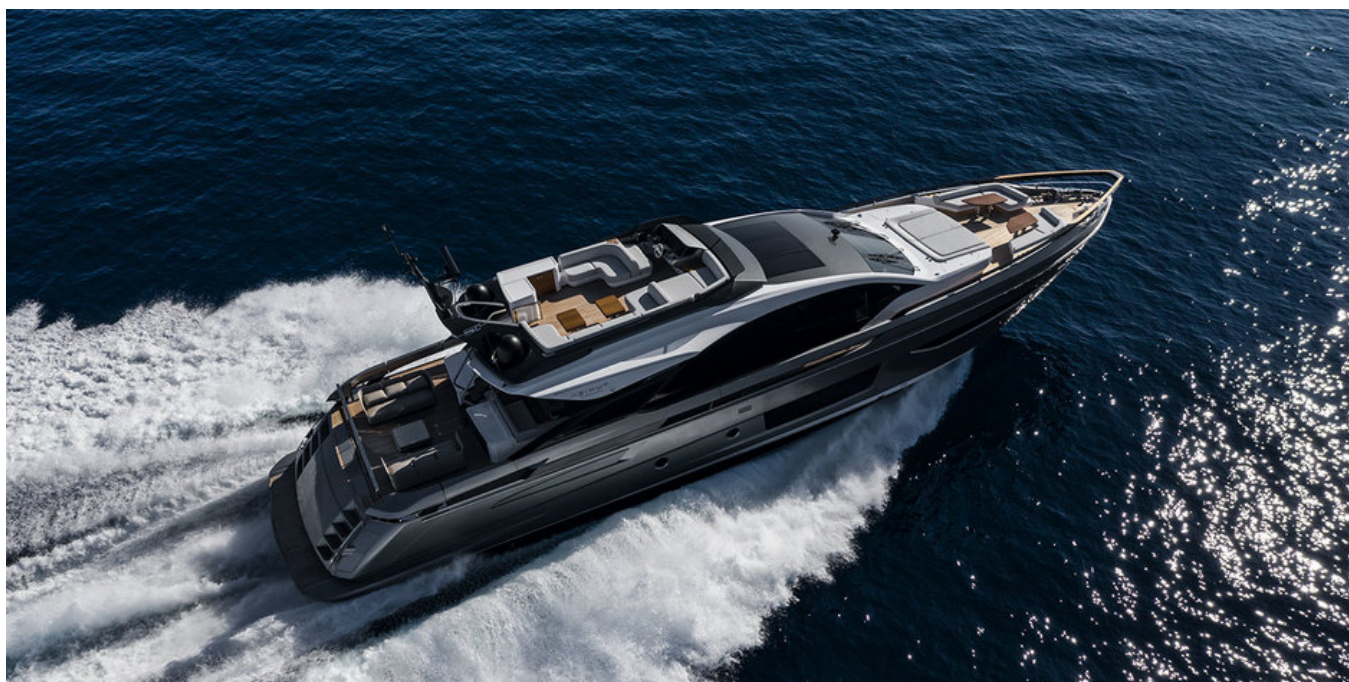
Экстерьер Azimut Grande S10