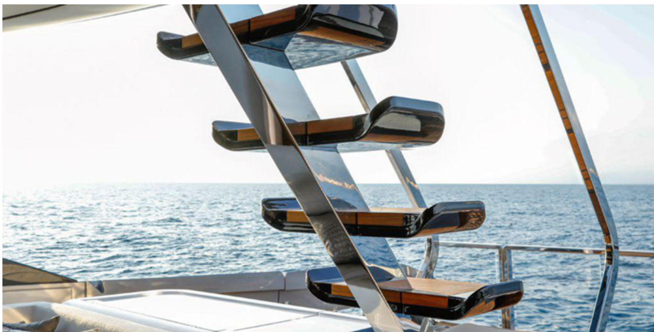
Ступени на кокпит