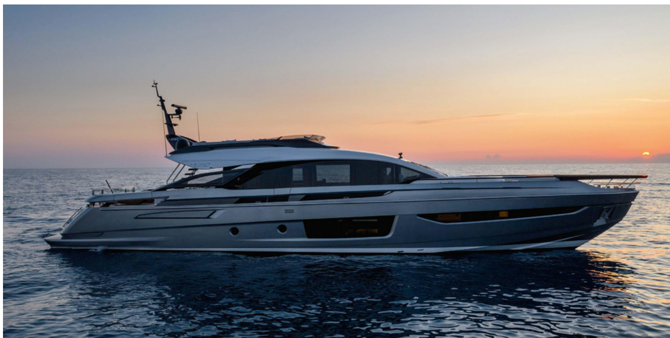
Экстерьер Azimut Grande S10