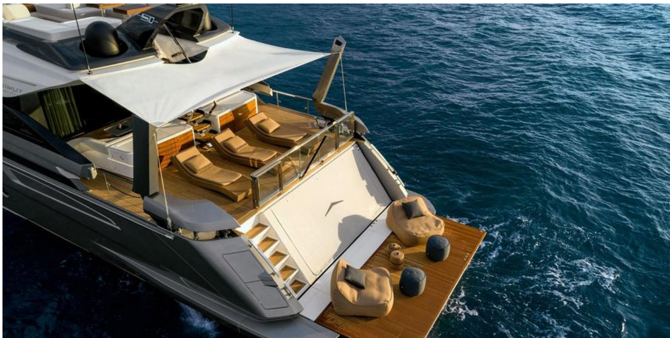
Экстерьер Azimut Grande S10