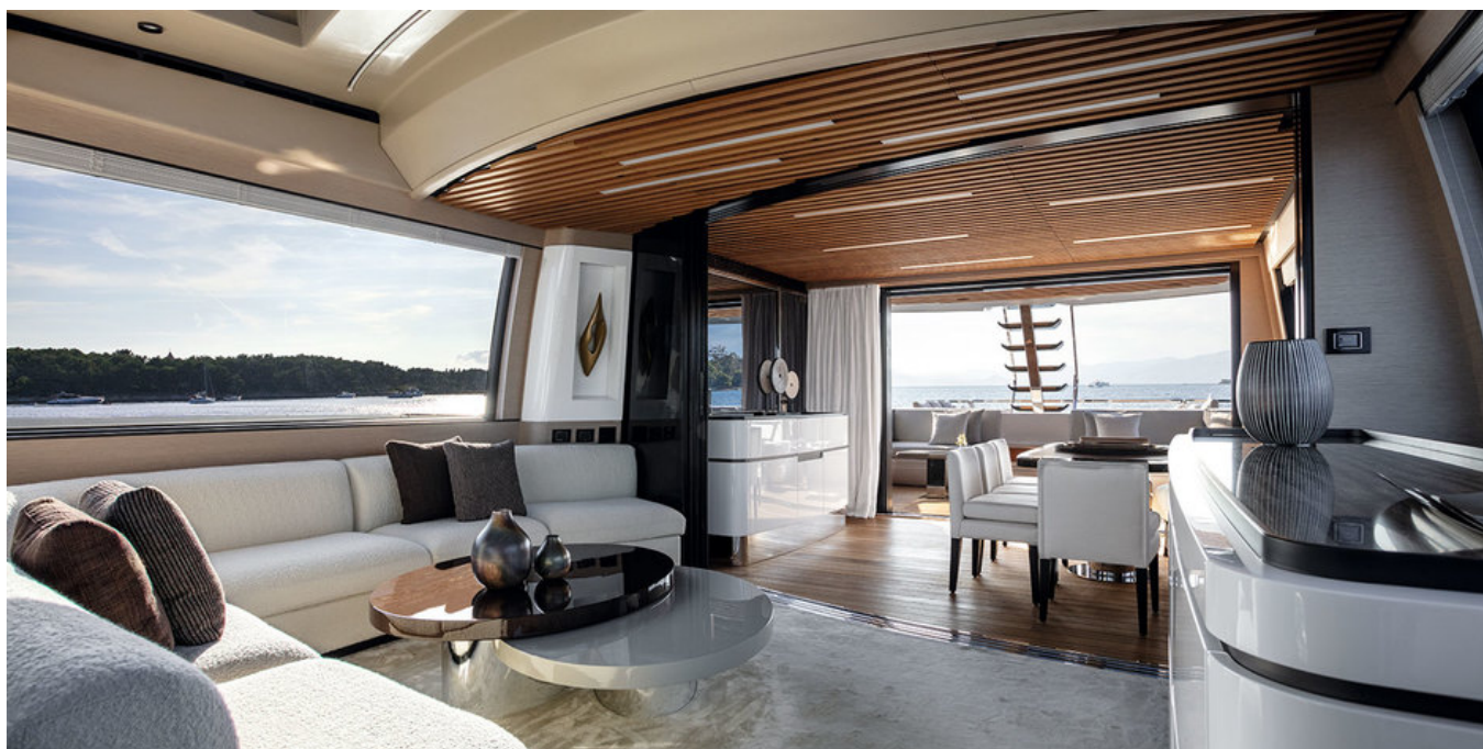
Салон на главной палубе