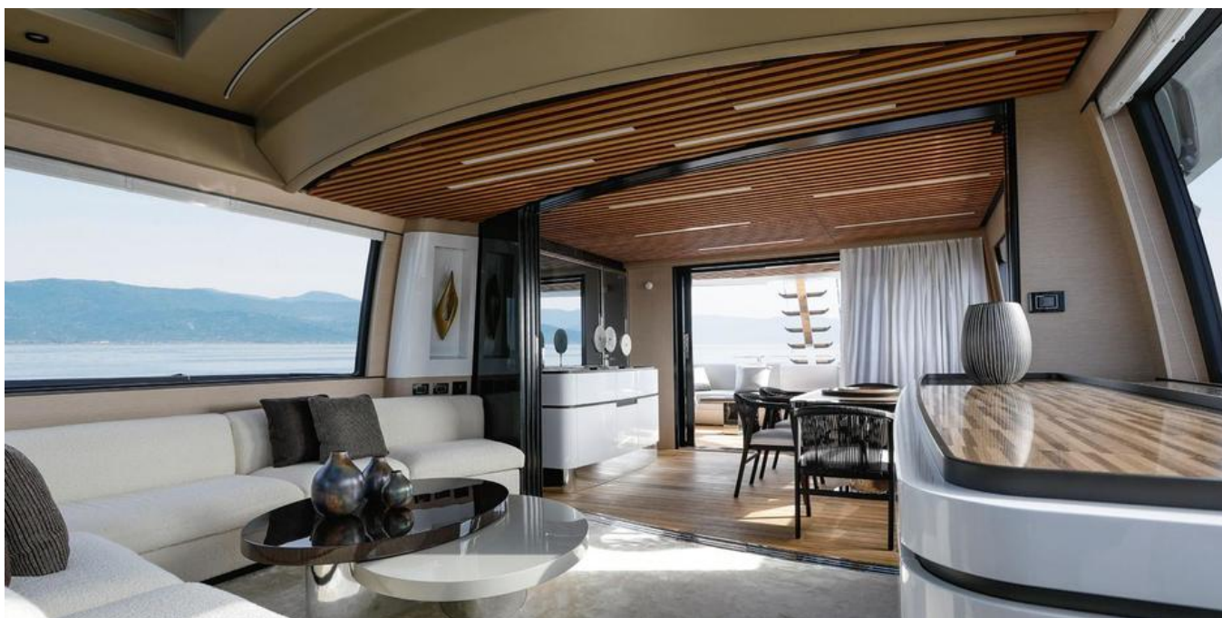
Салон на главной палубе