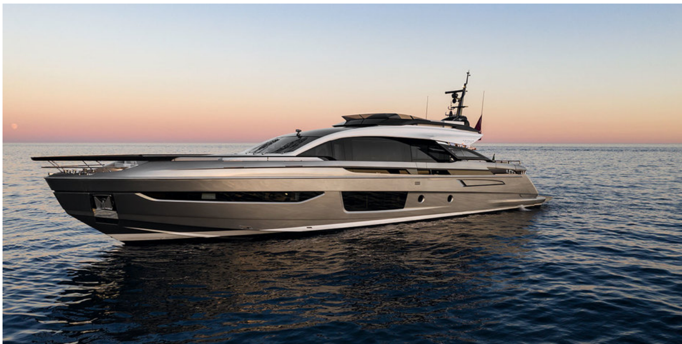
Экстерьер Azimut Grande S10