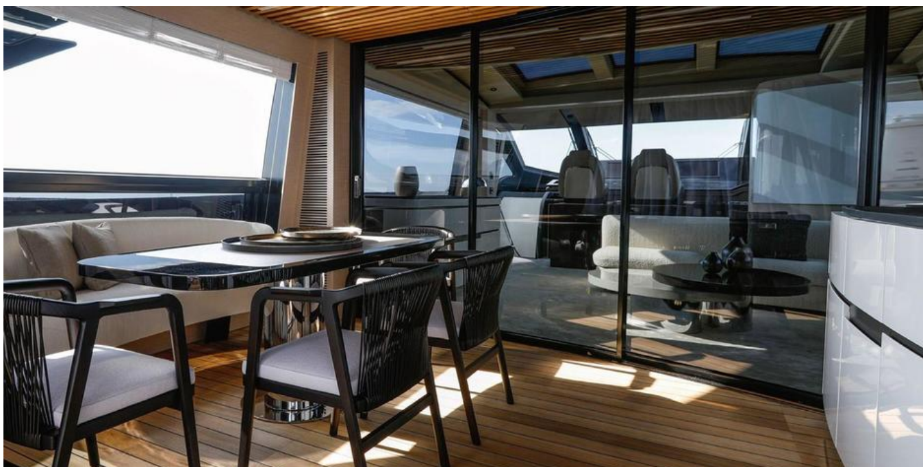
Салон на главной палубе