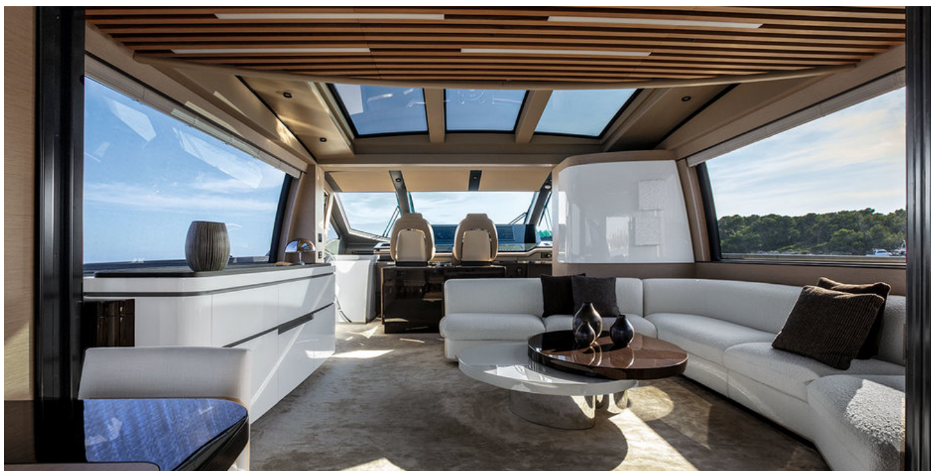
Салон на главной палубе