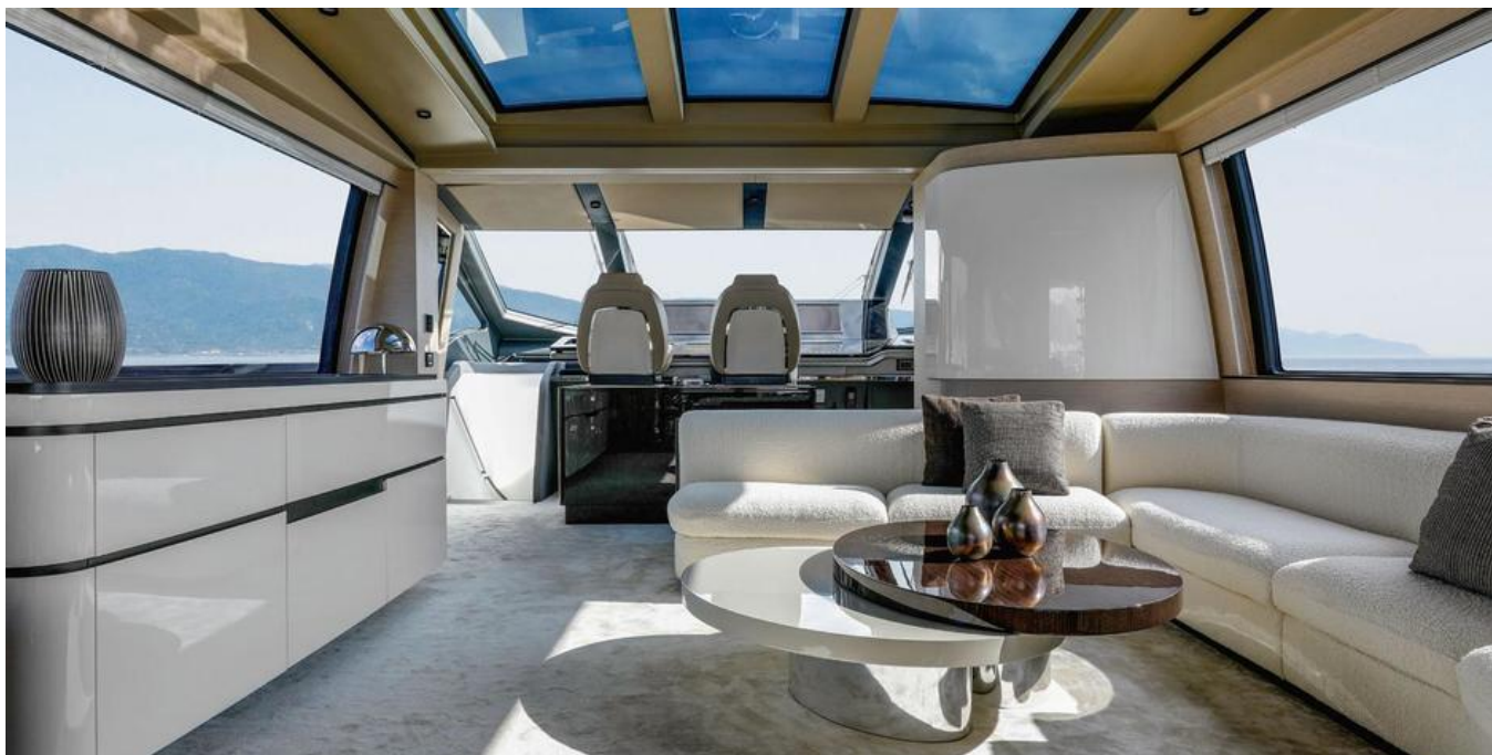
Салон на главной палубе