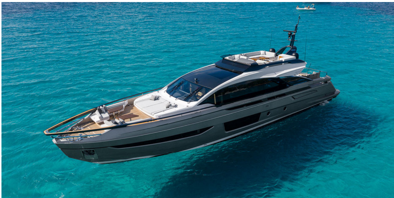
Экстерьер Azimut Grande S10