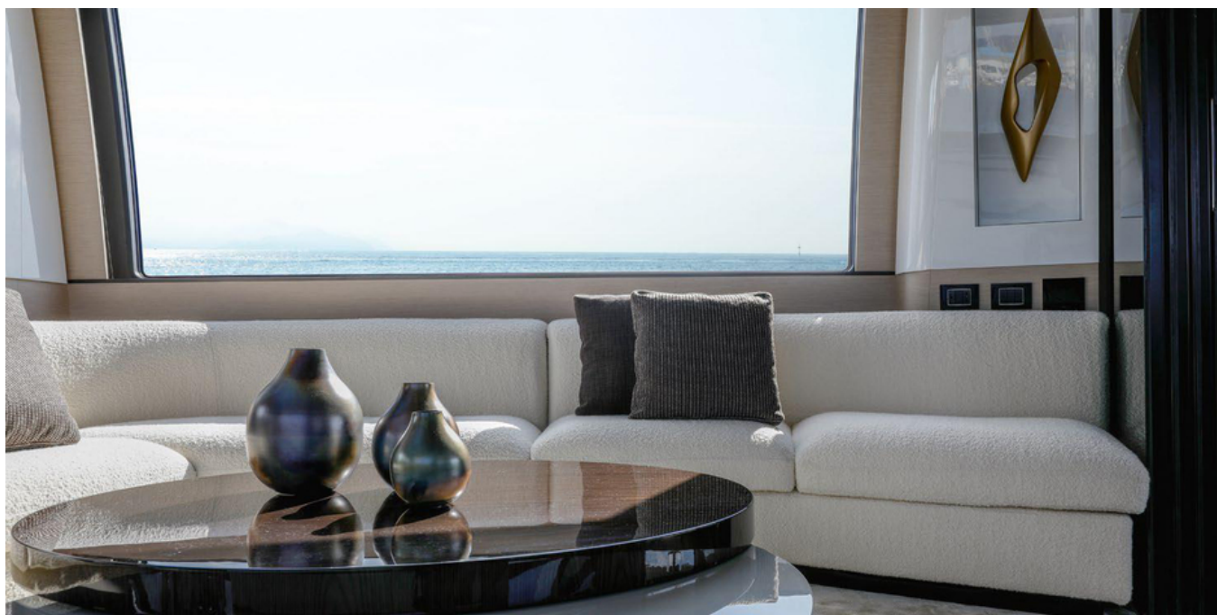
Салон на главной палубе