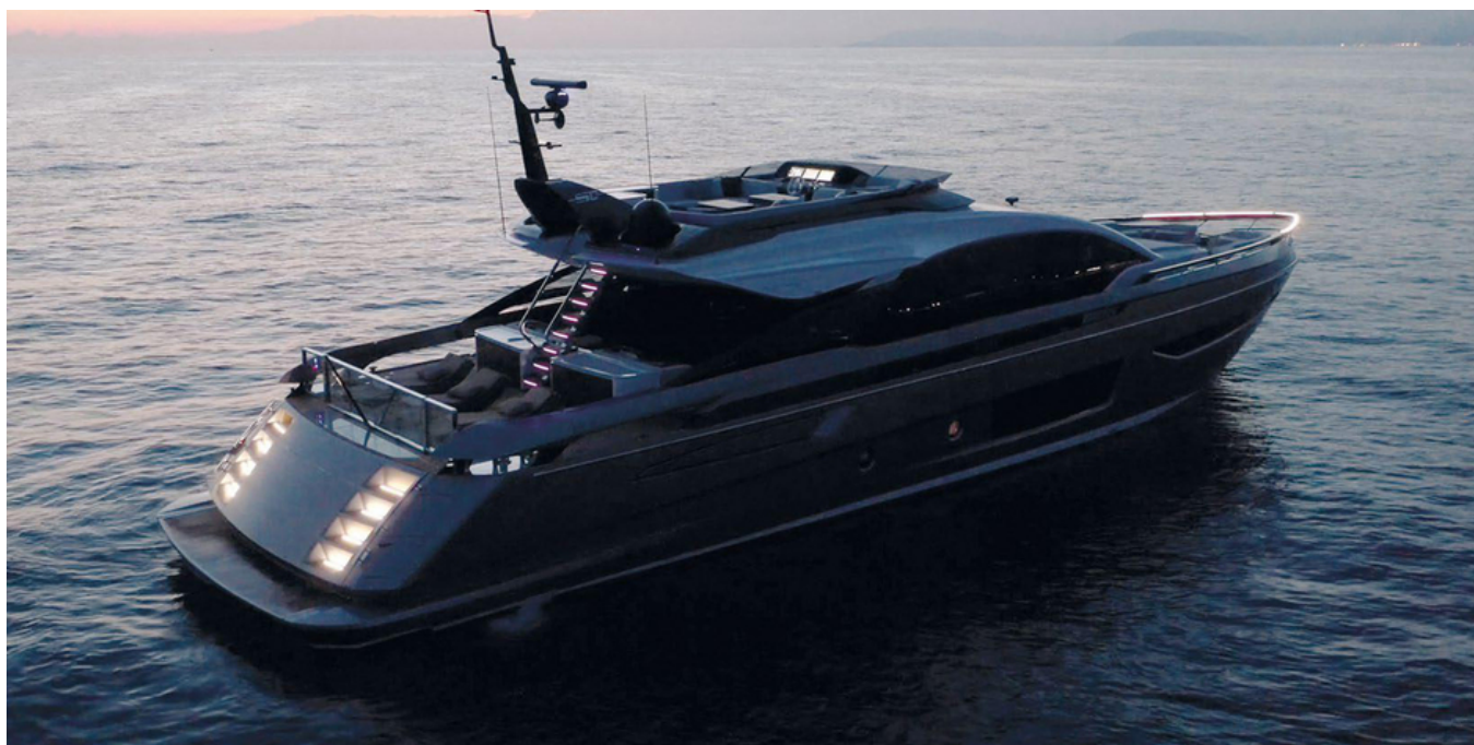
Экстерьер Azimut Grande S10