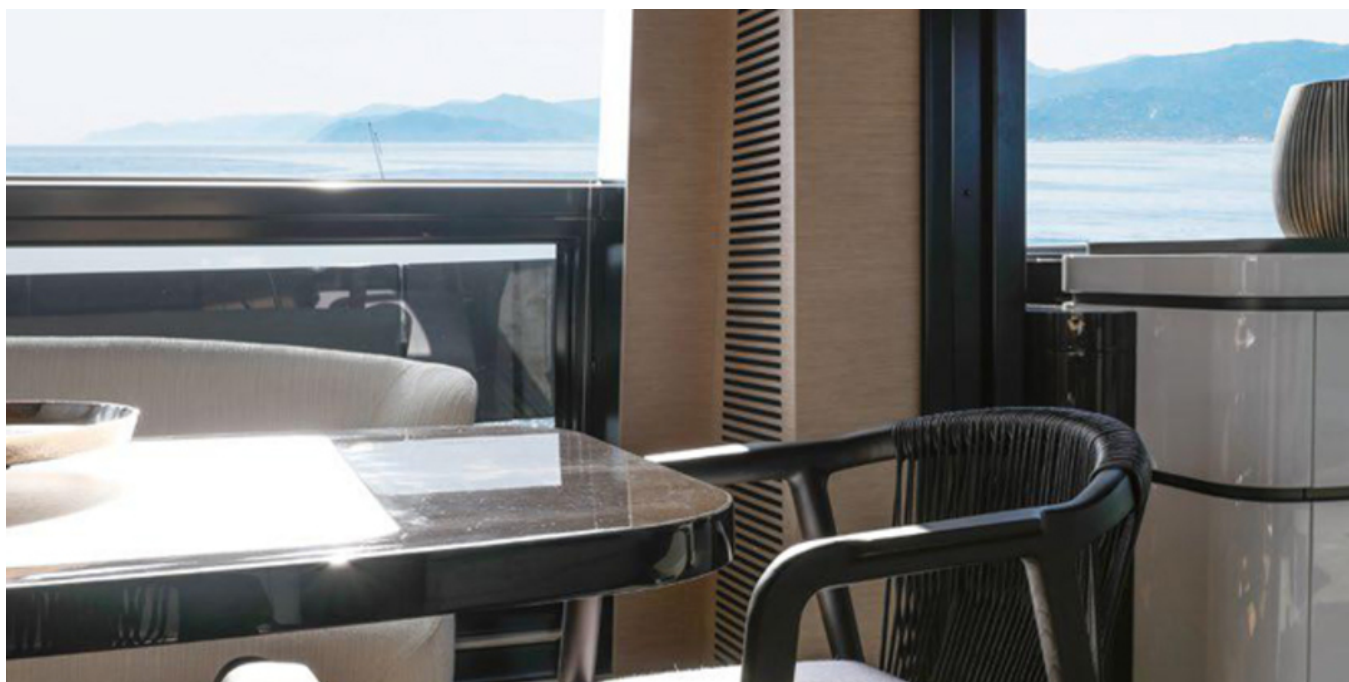
Салон на главной палубе