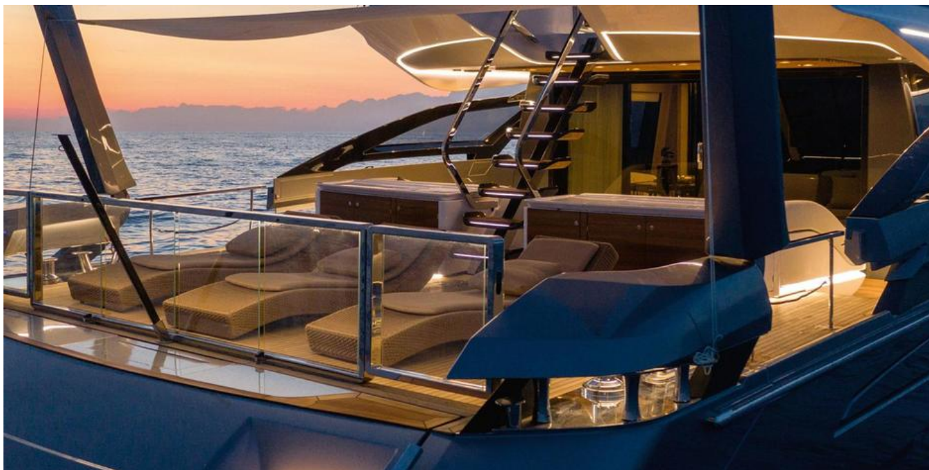
Экстерьер Azimut Grande S10