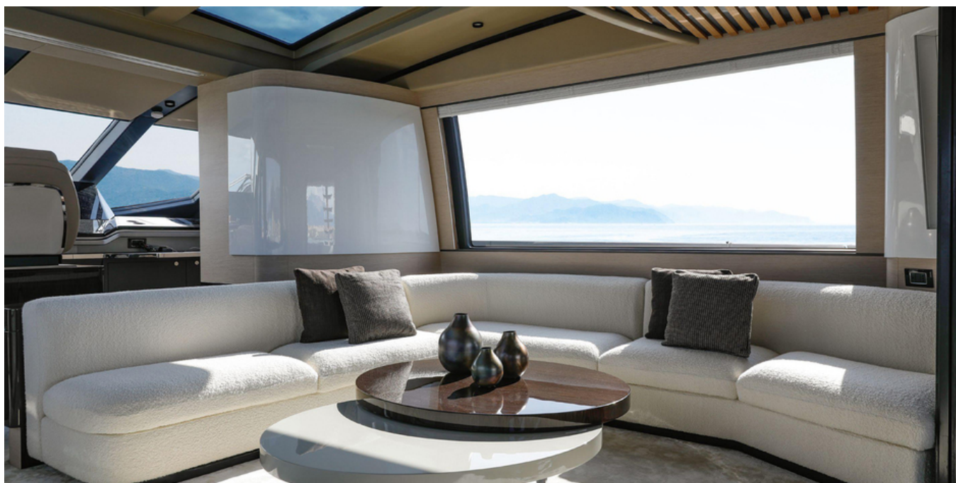
Салон на главной палубе