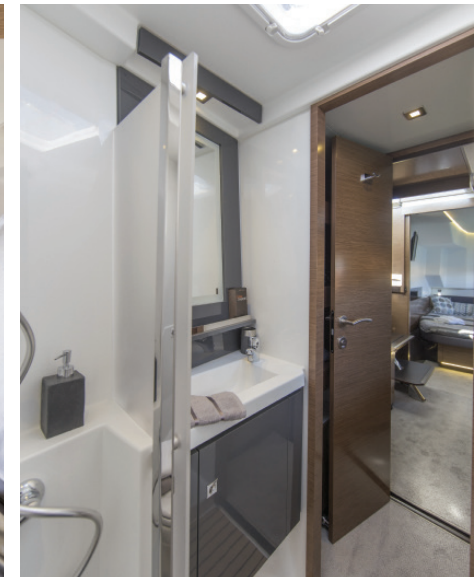
Owners' bathroom/ Salle de bain propriétaire