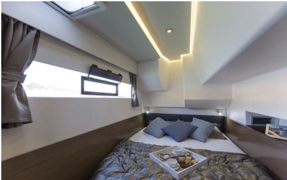
On starboard back cabin/ Cabine arrière tribord

Quatre très belles cabines et deux salles de bains sont réparties dans les deux coques.